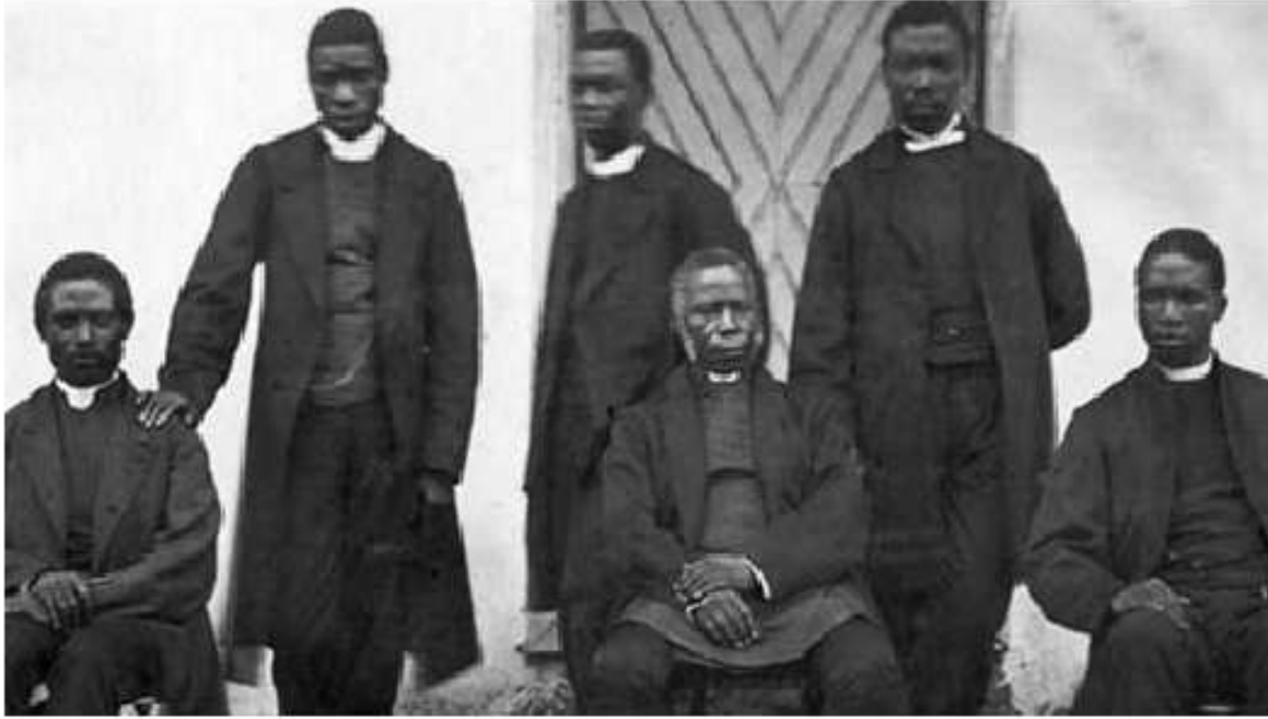
Figura 2 Crowther e seus ministros nativos da África