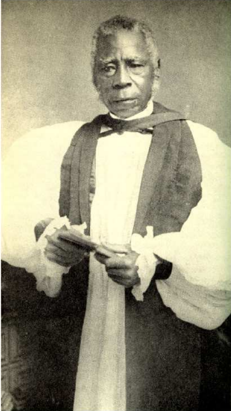
Figura 5 Bispo Samuel Ajayi Crowther