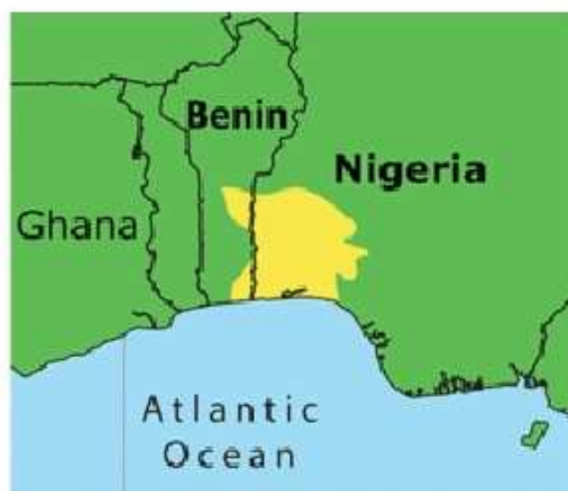
Figura 1- Região da Iorubalândia

Quando nos referimos ao termo Orixá, estamos ligados diretamente a um grupo africano etnolinguístico chamado nagô, que fala, em sua maioria, a língua ioruba. Os nagôs também são conhecidos como iorubas ou iorubanos. Ocupam uma região chamada de Iorubalândia. Este território, nos dias de hoje, compreende parte da Nigéria e do Benim (antigo Daomé), conforme foto abaixo: